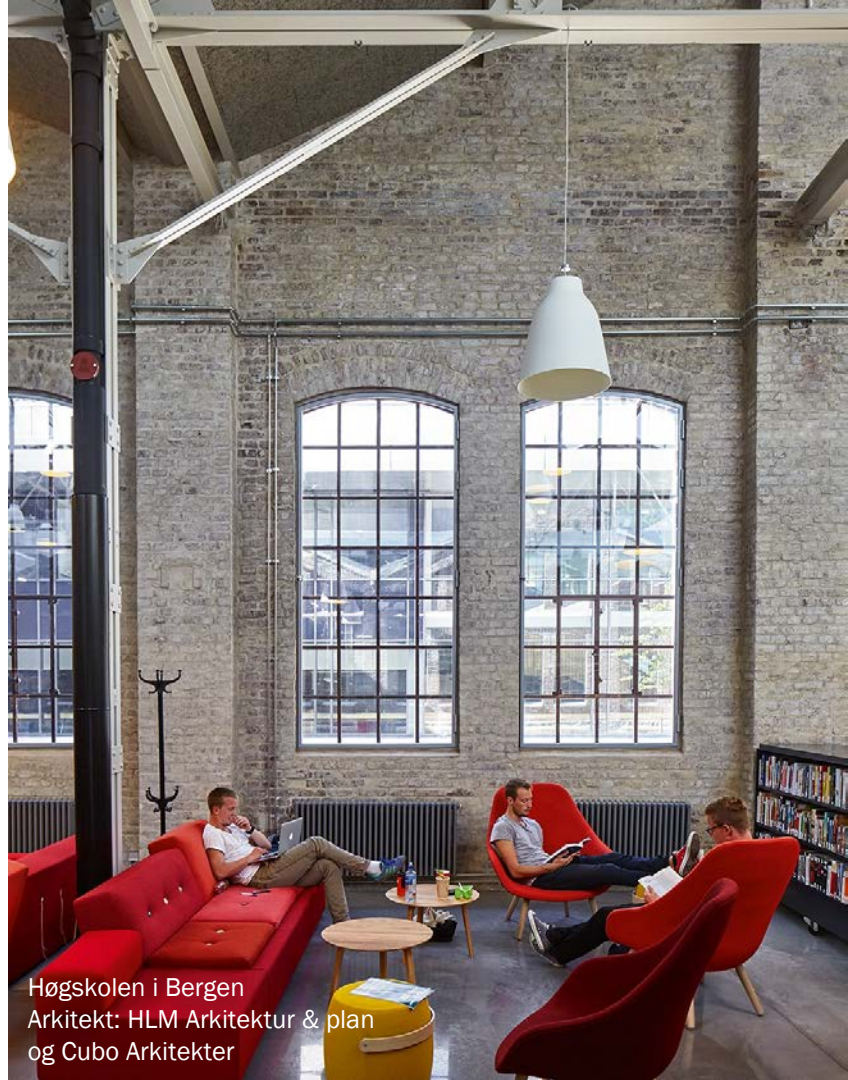
Høgskolen i Bergen Arkitekt: HLM Arkitektur & plan og Cubo Arkitekter